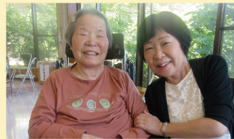
思わず笑みがこぼれます