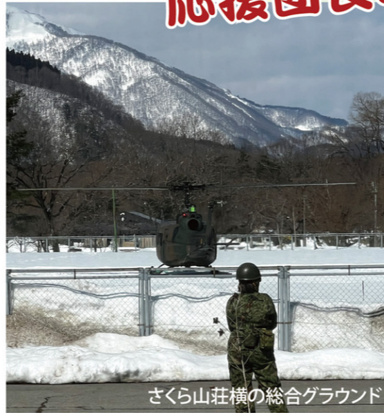
さくら山荘横の総合グラウンド