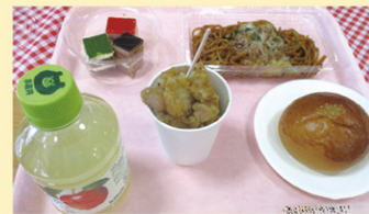
屋台メニュー どれも美味しそう!