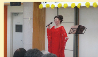
シャンソンの歌声に素敵な ひと時を過ごしました