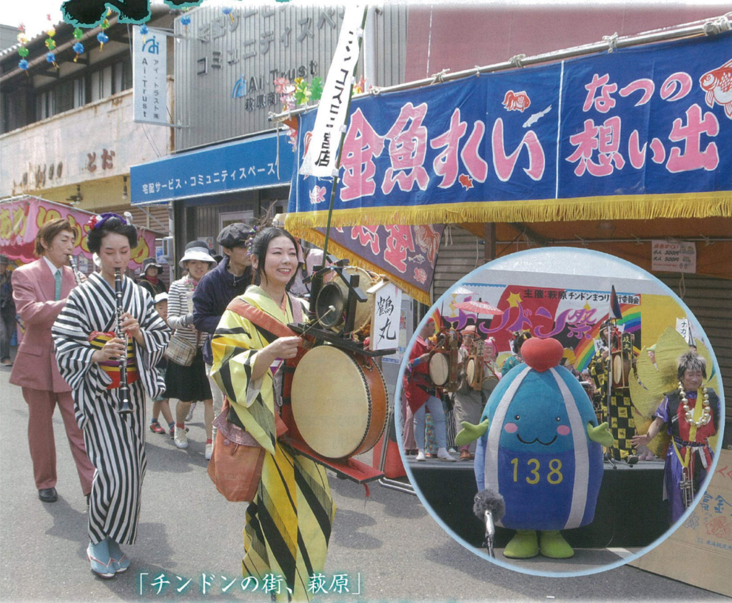
「チンドンの街、萩原」 5月25日(日)萩原商店街にて 第48回萩原全国チンドン祭りが開催されました。