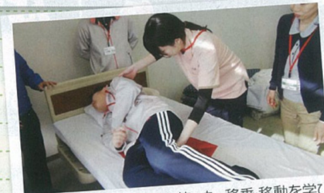
スライディングシートを使った、移乗・移動を学びました。ファミリーとスタッフの双方にやさしい介護をめざしています。

4月1日から新人スタッフ研修が始まりました。2週間にわたる研修で、26名全員が無事研修を修了することができました。内容は、社会人としての心構えから始まり、介護理念、接遇マナー、高齢者理解、介護技術などを先輩スタッフから学びました。研修が進むにつれ、不安と緊張した面持ちから、自信と希望に溢れる表情への変化が見られました。今後の皆さんの活躍を期待しています。