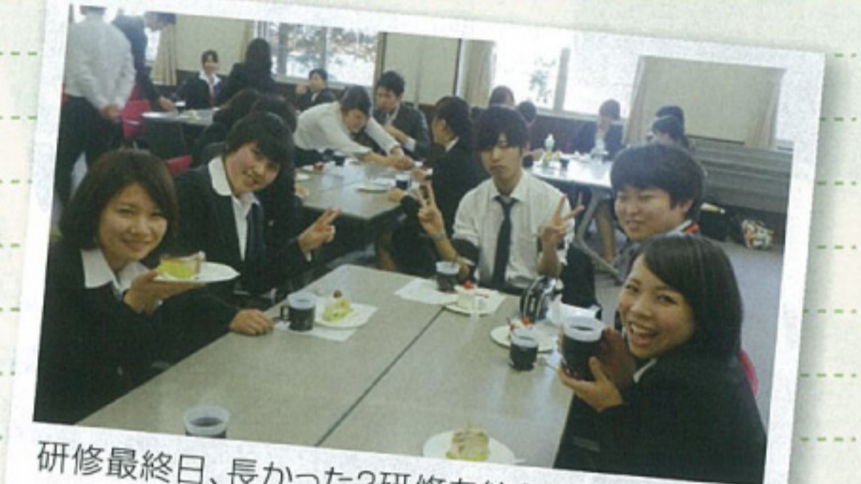
研修最終日、長かった?研修を終えてほっと一息、明日からは各施設に配属され、26名ばらばらになりますが、同期の絆を大切にしてください。