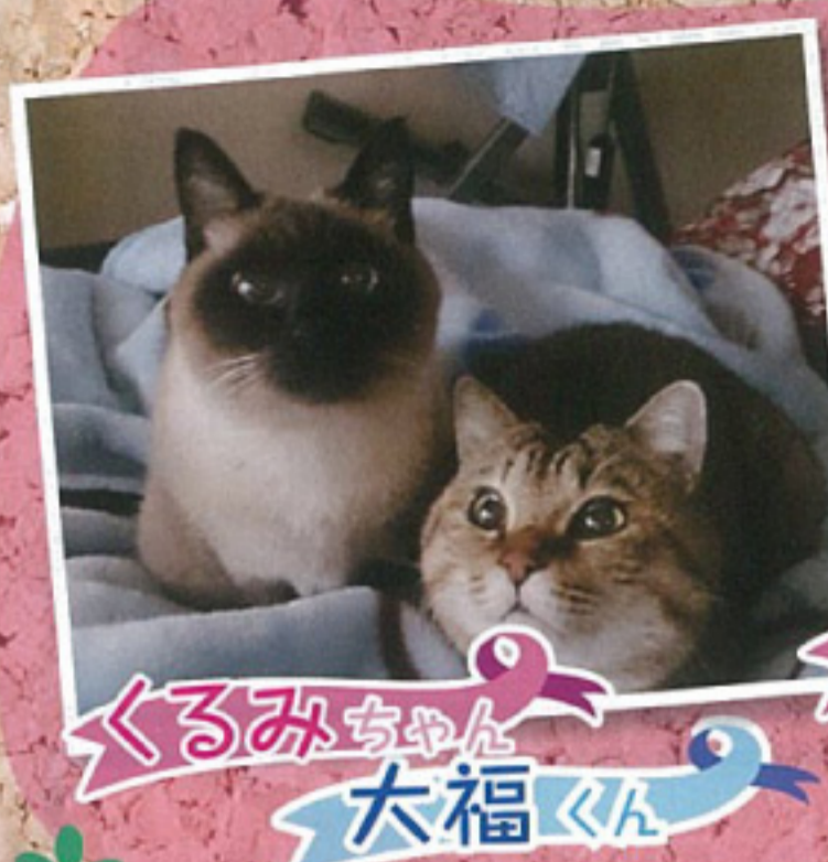
くるみちゃん 大福くん

日々、多忙な業務の中で、つかの間の癒しをくれるペットたちにスポットライトを当てて、ご紹介しています。 可愛いペットたちを見て、みなさん癒されてみてはいかがでしょうか？